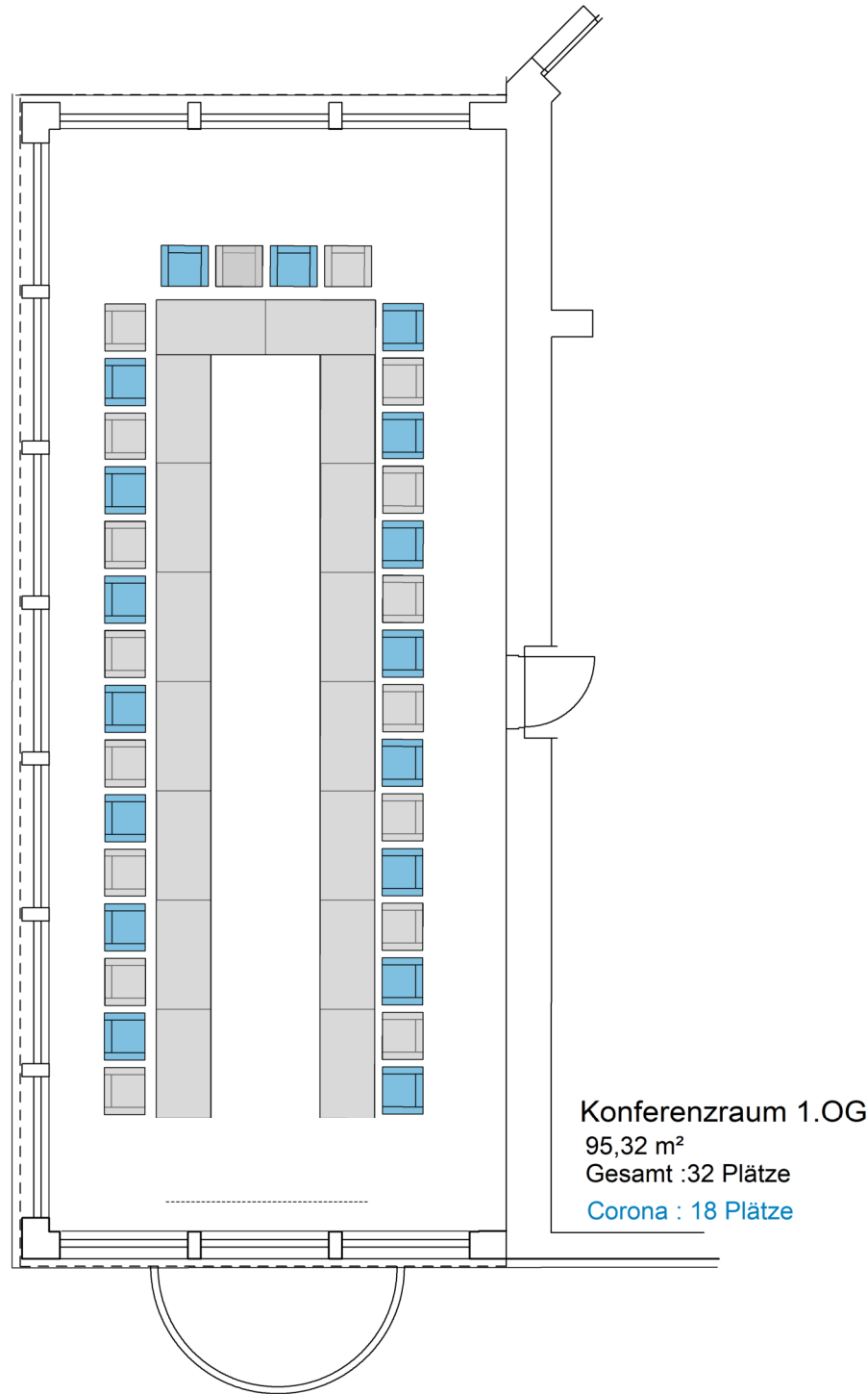
Konferenzraum 1.OG Haupthaus

Jägerstube 23.00 m 2 Gesamt . 10 Plätze Corona : 5 Plätze